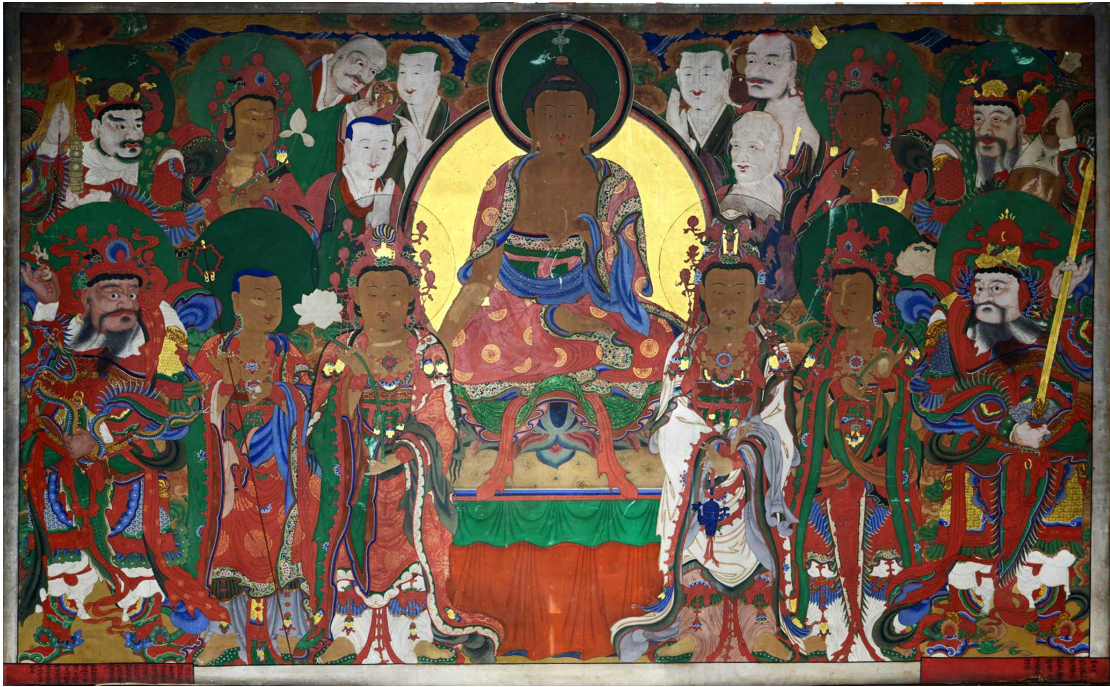
그림 15. 미타사 칠성각 아미타여래회도, 1897년, 면본채색, 세로 146cm, 가로 231cm, 미타사 칠성각.

간이 함께 조성한 불화는 <봉원사 삼장보살도(1905)>, <불암사 신중도(1907)> 등으로 사자암 본 조성 이후이지만 그 이전에도 흥국사 화맥의 인연을 따라 교류는 있었을 것으로 추정된다.