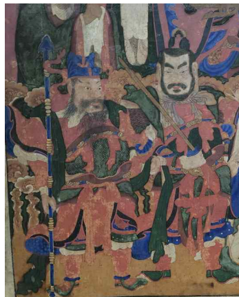
그림 19. 사자암과 백련사 신중도의 세부형태 비교.

그렸던 수원 <봉림사 치성광여래회도>의 초를 그대로 사용하고 있어 공법과 축연의 화연관계가 깊었음을 짐작할 수 있다. 백련사 본과 <중대 사자암 신중도>의 구성을 비교해 보면 사자암 본의 제작에 축연이 직접 참여하지는 않