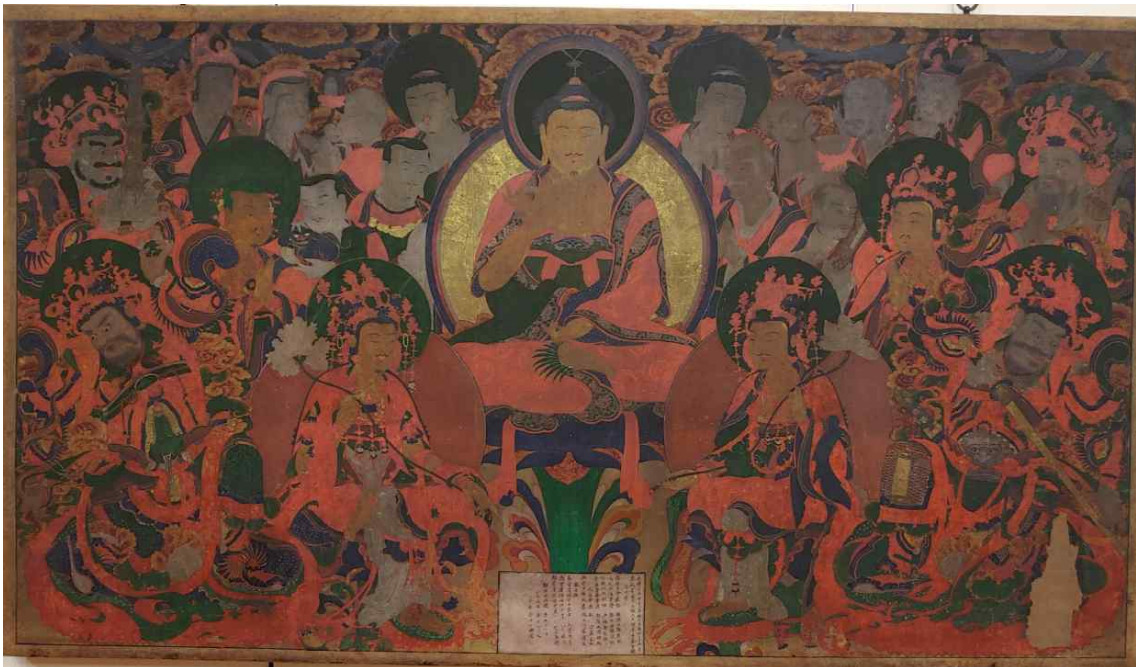
그림 5. <중대 사자암 석가여래회도>, 1894, 면본채색, 화면 전체 가로 238cm, 세로 137cm, 월정사 성보박물관.

<중대 사자암 석가여래회도>는 오대산 중대 사자암 향각(香閣)에 봉안되었던 불화로 주존불인 목조 비로자나불좌상의 후불도로 모셔져 있었다. 이 그림은 면 3매를 화면의 길이만큼 재단하여 세로로 잇대어(향 좌로부터 97cm, 106cm, 36cm) 바탕질을 마련하여 나무로 짠 틀에 올린 패널 형태로 상부에는 그림을 걸 수