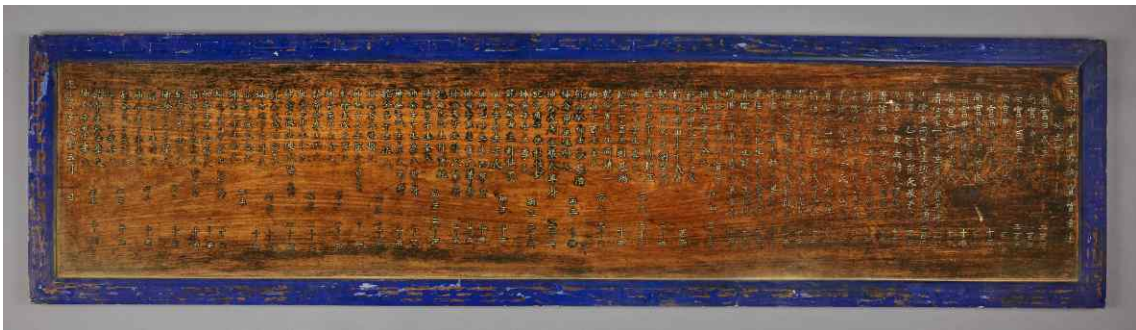
그림 10. <중대적멸보궁시주질> 현판, 1878, 나무(월정사박물관)