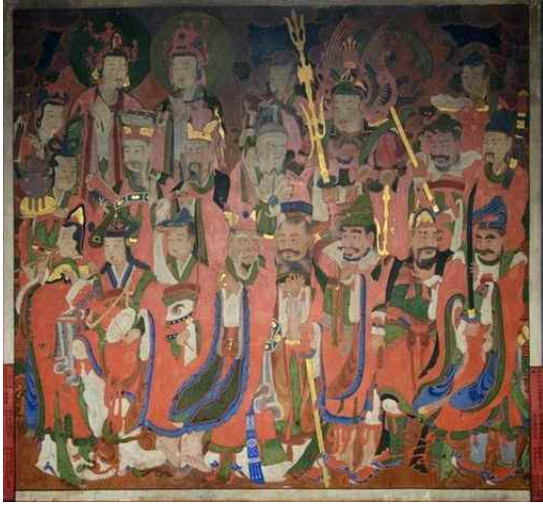
그림 16. 미타사 칠성각 신중도, 1899, 면본채색, 세로 159cm, 가로 143.5cm, 칠성각 요사.