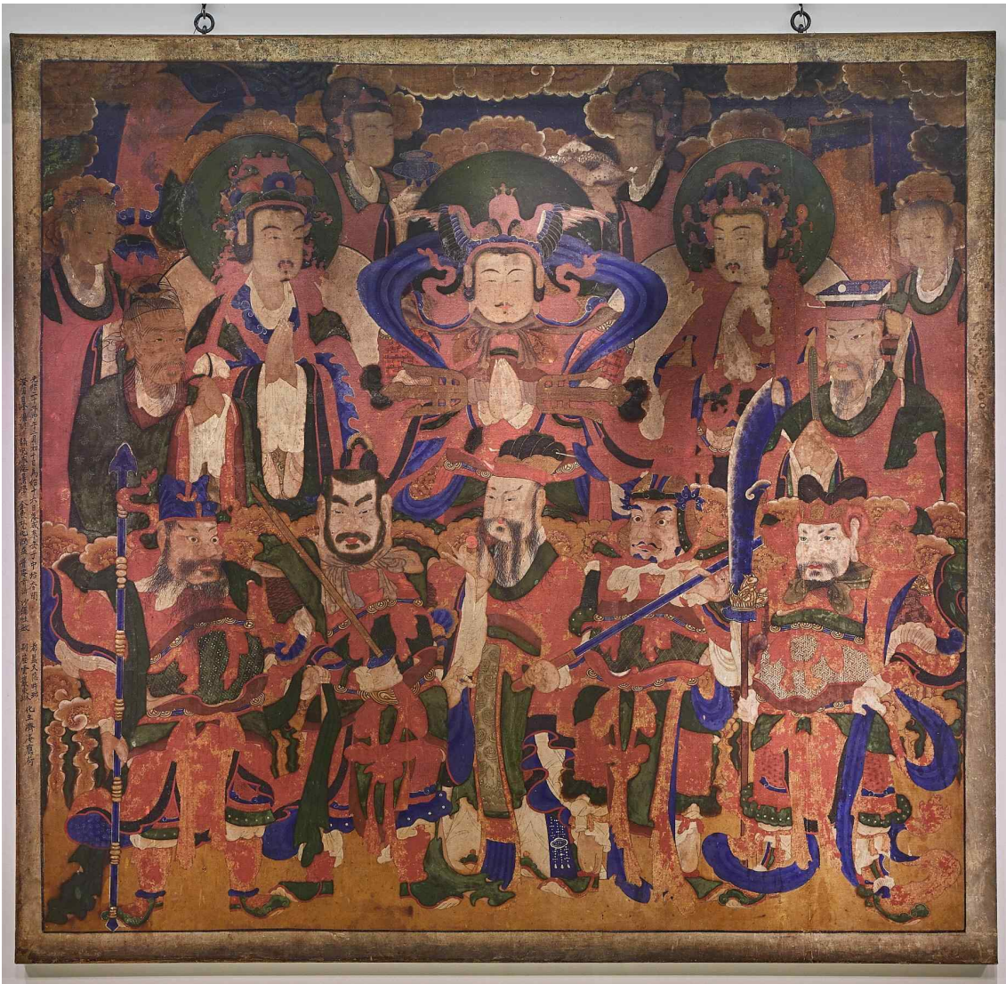
그림 7. <중대 사자암 신중도>, 1894, 면본채색, 화면 전체 가로 122cm, 세로 115cm, 월정사 성보박물관.

『화엄경』에 사상적 배경을 두고 있는 신중도는 여래가 그려져 있지 않은 불화