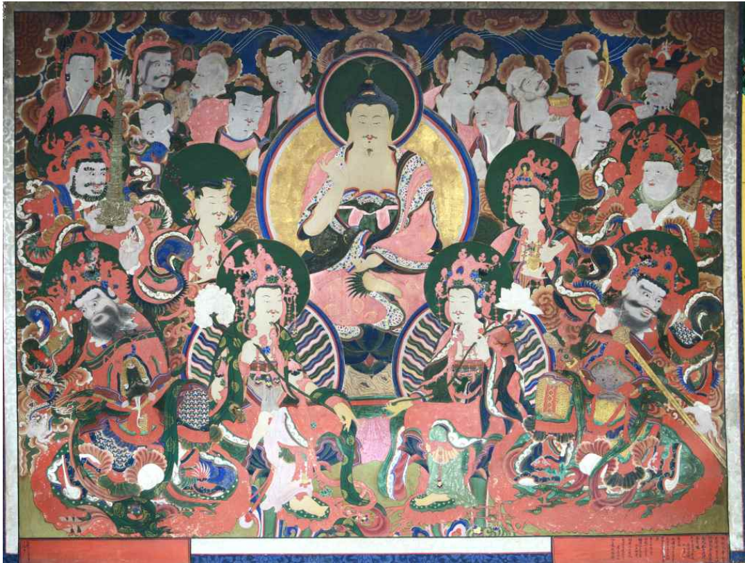
그림 13. <견성암 아미타여래회도>, 1882, 면본채색, 세로 163cm, 가로 211cm, 남양주 견성암 대웅전.

김씨(慶嬪 金氏 1831-1907)와 그녀의 동생 김훈현으로 왕실 관련 인물들이다.