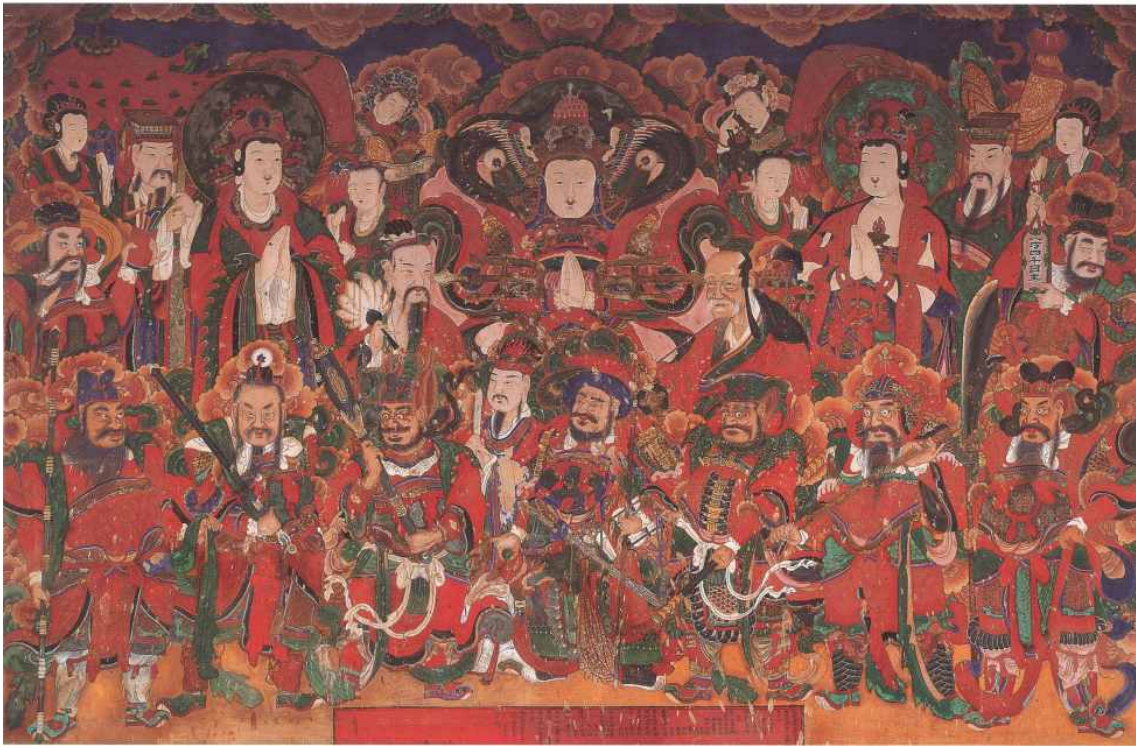
그림 18. <백련사 극락전 신중도>, 1888, 면본채색, 세로 145.7cm, 가로 221.5. 강화 백련사