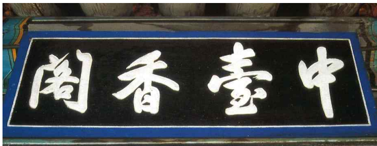
그림 4. 중대향각 편액, 조선시대, 나무.

19세기 말 적멸보궁을 증수하고 기록한 현판에 따르면 1767년(건륭 32, 丁亥年) 연파화상(延波和尙)이 적멸보궁을 수리했다 전하는데 단원의 그림 속 적멸보궁과 사자암은 아마도 전각의 증수불사가 완성된 이후의 모습일 것이다. 13)