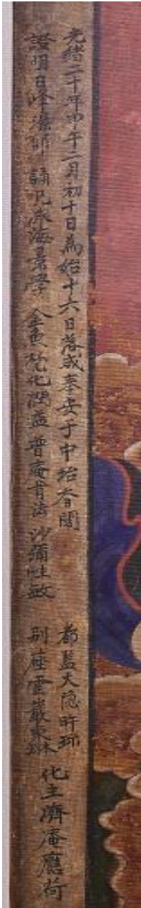
그림 8. 신중도 화기

감독하여 음식을 마련하는 소임인 별좌를 맡은 비구는 대은 오진(大隱昨玆)과 운암 동림(雲巖東琳)으로 이들 역시 석가여래회도와 같다.