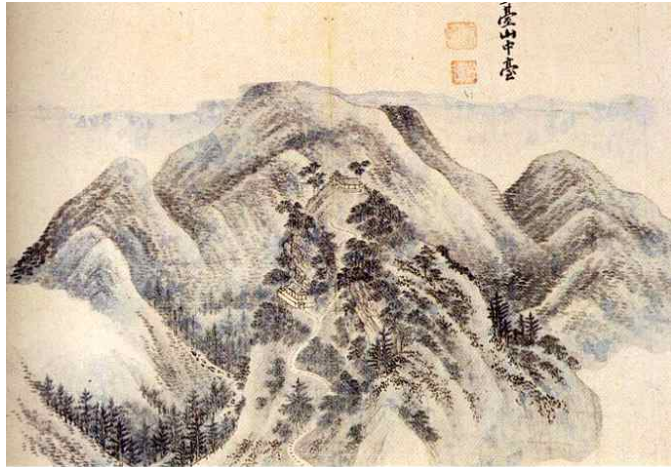
그림 2. 오대산 중대. 1788년, <금강사군첩> 부분, 견본담채, 30×43.7cm, 개인소장.

1788년 김홍도는 왕명을 받아 금강산을 답사하며 「금강사군첩(金剛四郡帖)」을 그렸다. 화첩 가운데 오대산 중대 지역을 그린 <오대산중대(五臺山中臺)>라는 화제(畫題)가 쓰인 화폭에서 산 정상 적멸보궁 아래에 있는 암자는 위치로 보면 중대와 열 걸음 정도 떨어져 있었다던 금몽암이 아니라 사자암을 나타낸 것이다. 그림 속 낮은 담장으로 둘러싸인 사자암은 정면 4칸에 측면 2칸의 팔작지붕을 얻은 전각이다.