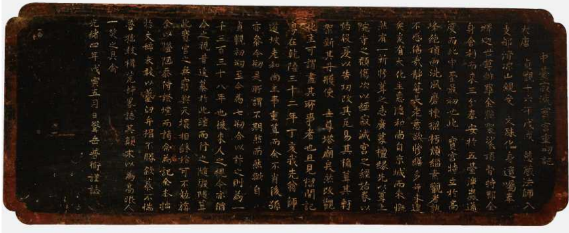
그림 9. <중대적멸보궁중창기> 현판, 1878, 나무(월정사박물관)

19세기 사자암 불화를 조성하기 이전 적멸보궁의 재건을 위한 몇 차례의 시도 가운데 대규모로 공사가 진행된 시기는 1878년(光緒 4)이다. 23) 용악 보위(聳岳普衛)가 쓴 <중대적멸보궁중창기(寂滅寶宮重創記)>에는 화주 혜은(惠隱)화상이 경