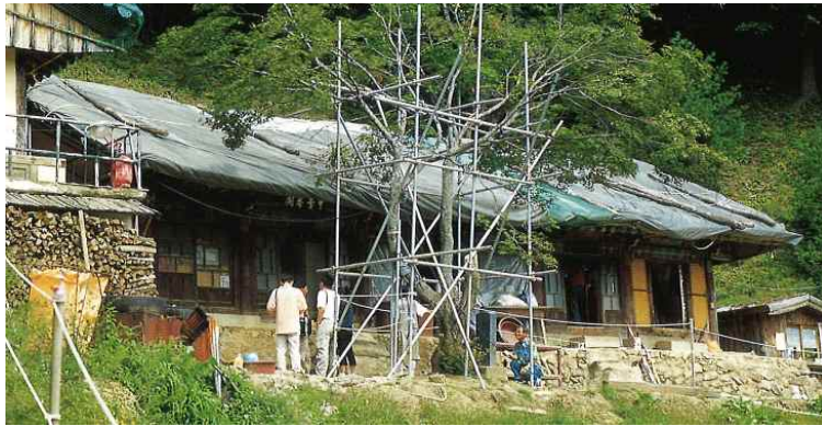
그림 3. 향각, (2002년, 『한국의 사찰문화재_강원도』)

1788년 김홍도는 왕명을 받아 금강산을 답사하며 「금강사군첩(金剛四郡帖)」을 그렸다. 화첩 가운데 오대산 중대 지역을 그린 <오대산중대(五臺山中臺)>라는 화제(畫題)가 쓰인 화폭에서 산 정상 적멸보궁 아래에 있는 암자는 위치로 보면 중대와 열 걸음 정도 떨어져 있었다던 금몽암이 아니라 사자암을 나타낸 것이다. 그림 속 낮은 담장으로 둘러싸인 사자암은 정면 4칸에 측면 2칸의 팔작지붕을 얻은 전각이다.