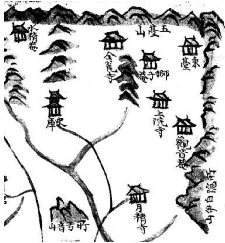
그림 1. 신증동국여지승람 강릉대도호부 부분, 1760(한국고전종합DB)