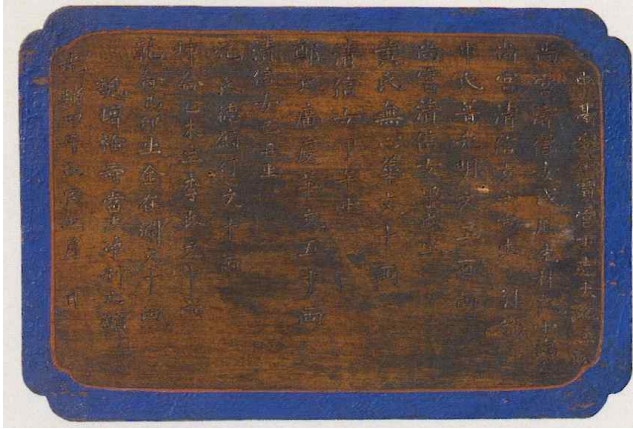
그림 11. <중대적멸보궁대시주질> 현판, 1878, 나무(월정사박물관)

수도권이 아닌 지역의 사찰 불사에 많은 궁인들이 참여한 까닭에 대한 정확한 이유는 기록에 없어 알 수 없다. 시주자 중에서 거금을 시주한 기유생 천씨는 천일청(千一淸)이라는 인물이다. 효정왕후 홍씨와 철인왕후 김씨는 소생이 없어 적적한 궁중의 무료함을 달래기 위해 어린 궁녀를 대비전에서 함께 돌봤다고 전해지는데