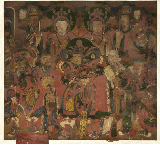
그림 17. 미타사 약사전 신중도, 1901, 면본채색, 세로 123cm 가로 134.8cm, 마포 석불사 설법전

19세기 후반 수도권에서 조성된 신중도는 화승들 사이에서 호응이 높았던 <봉원사 신중도(1844)> 또는 응석이 출초한 <강화 보문사 신중도(1867)> 도상을 전형(典型)으로 해 변용된 형태로 제작되고 있다. 공법과 윤익이 제작한 <옥수동 미타사 칠성각 신중도(1899)>와 <옥수동 미타사 약사전 신중도(1901)>의 도상도 그 범주를 따르고 있다.<그림 16, 17> 반면 범화 윤익이 금어로 처음 조성한 <중대 사자암 신중도>는 공유되던 신중도상이 아닌 이봉당 중린(尼峯 仲麟)이 수화승으로 축연과 공법이 함께 작업했던 <강화 백련사 신중도(1888)>의 도상을 축소 변용한 형태이다.